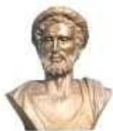
Liceo "Archita" Taranto