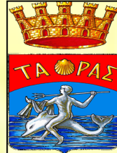
Comune di Taranto